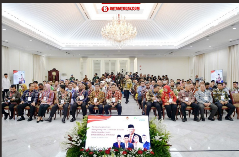
Suasana penyerahan penghargaan Paritrana Award di Aula Kantor Wakil Presiden RI