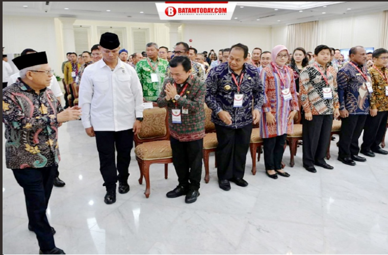
Suasana kehadiran Wakil Presiden RI di Aula Kantor Wakil Presiden pada acara penyerahan penghargaan Paritrana Award

Batam Today @Batamtoday @Batamtoday Batam Today