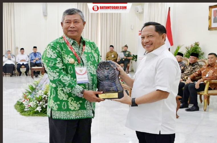
Bupati saat menerima penghargaan Paritrana yang berikan oleh Kemendagri

Abadikan moment spesial Anda di BATAM TODAY Gallery Photo untuk pemesanan hubungi: Telp: (0778) 7482-514 Email: batamtoday@gmail.com