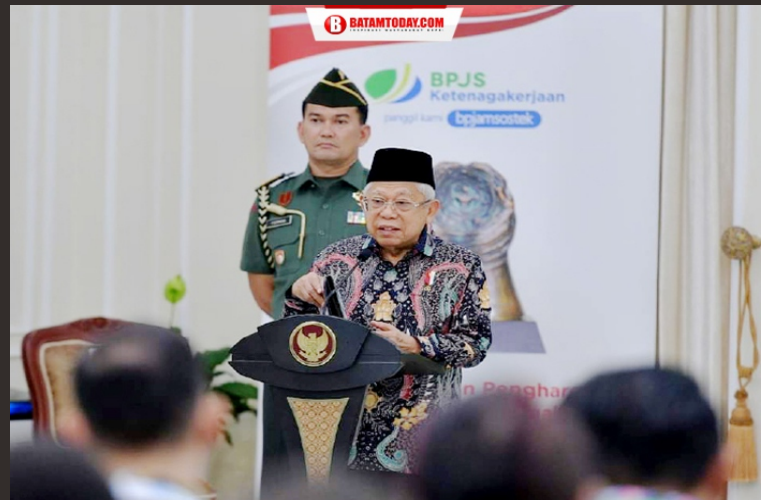
Wakil Presiden RI, Ma'rif Amin saat menyampaikan pesan kepada Kepala Daerah Penerima Paritrana Award 2023