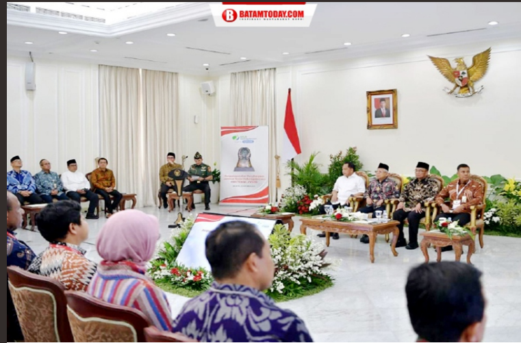
Wakil Presiden RI, Kemendagri, Kepala BPJS Ketenagakerjaan saat menyaksikan pembacaan program Paritrana Award 2023