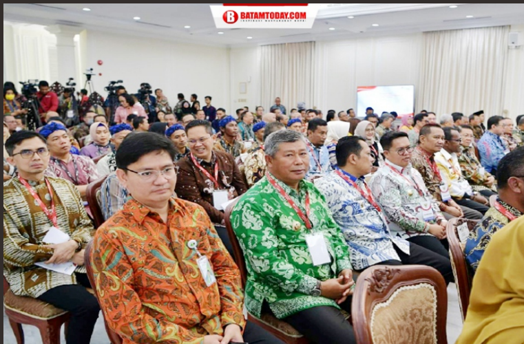
Bupati Kepulauan Anambas saat duduk bersama Kepala Daerah yang menerima Paritrana Award 2023